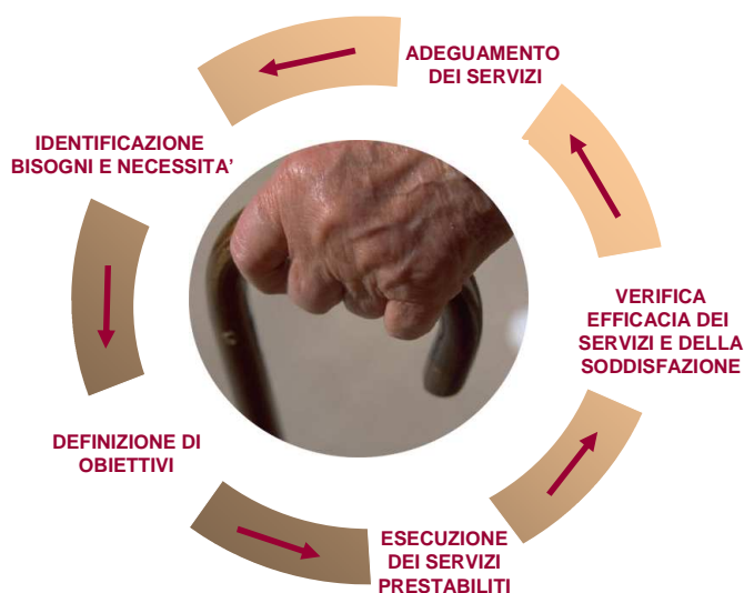
Fig. 1: Identificazione e verifica dei bisogni dell'anziano

Questo Documento ha quindi anche lo scopo di illustrare in sintesi i principali aspetti operativi che quotidianamente concorrono all'erogazione delle prestazioni offerte, sottese alla costante ricerca del miglioramento della qualità della vita delle persone ospitate. Tutti i processi operativi si sviluppano attorno ad alcune linee guida imprescindibili quali la centralità della persona, la promozione della vita attraverso la costruzione di relazioni significative, l'assistenza alla persona anziana e l'incoraggiamento dei contatti tra l'ospite residente e l'esterno, rappresentato dalla famiglia, dai conoscenti e più in generale dal contesto socio territoriale di appartenenza. Tali principi sono ulteriormente sviluppati nel documento denominato politica della qualità allegato alla presente carta dei servizi.